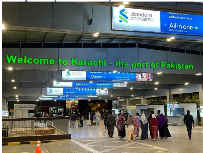
Arrivée des 17 Rotariens du District 1710 dans la nuit du 26 février 2024 à l'Aéroport de Karachi.